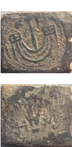
1 Philipsgulden / Philippus-gulden - (1496 - 1520) - goud - 3,30 g - Nederlanden