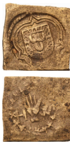
1 Leeuw - (1454 - 1460) - goud - 4,25 g - Nederlanden