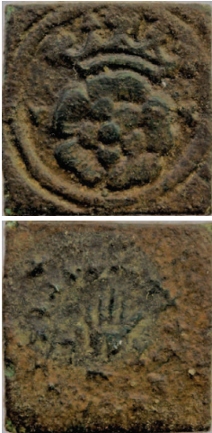
1 Reaal / Keizers-reaal / Konings-reaal - (1521 - 1598) - goud - 5,32 g - Nederlanden