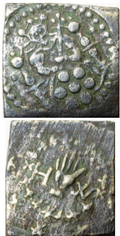
1/4 Pound - (1526 - 1544) - goud - 3,73 g - Engeland