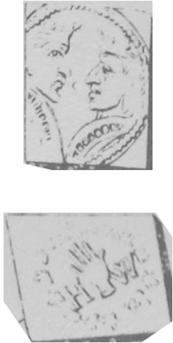
1 Forint - (1527 - 1848) - goud - 3,49 g - Hongarije