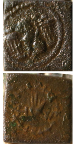
1 Noble - (1416 - 1585) - goud - 6,80 g - Engeland