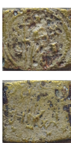
1 Philipsgulden / Philippus-gulden - (1496 - 1520) - goud - 3,30 g - Nederlanden