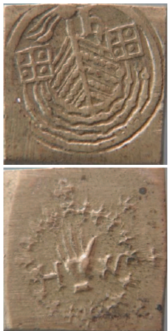
1 Noble - (1416 - 1585) - goud - 6,80 g - Engeland