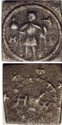
Goldgulden - (1490 - 1523) - goud - 3,28 g - Duitse Rijk