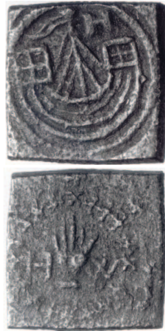
1/2 Noble - (1428 - 1585) - goud - 3,40 g - Engeland