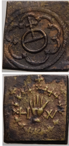
Horner-gulden - (1484 - 1505) - goud - 2,4 g - Nederlanden