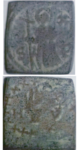
1/2 Pound - (1545 - 1550) - goud - 6,22 g - Engeland