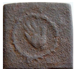
1/2 Noble - (1428 - 1585) - goud - 3,40 g – Engeland