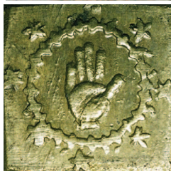
1/2 Ryal - (1464 - 1470) - goud - 3,89 g – Engeland