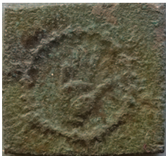
1 Philipsgulden / Philippus-gulden - (1496 - 1520) - goud - 3,30 g – Nederlanden