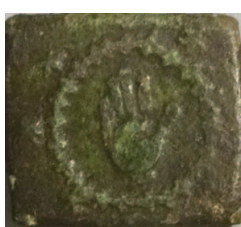
1 Philipsgulden / Philippus-gulden - (1496 - 1520) - goud - 3,30 g – Nederlanden