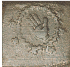
1/4 Pound - (1526 - 1544) - goud - 3,73 g – Engeland