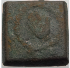
Goldgulden - (1490 - 1523) - goud - 3,28 g – Duitse Rijk