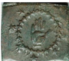
1/2 Reaal / Keizers-reaal / Konings-reaal - (1521 - 1598) - goud - 3,50 g – Nederlanden