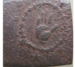
1 Reaal / Keizers-reaal / Konings-reaal - (1521 - 1598) - goud - 5,32 g – Nederlanden