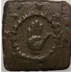
2/3 Leeuw - (1454 - 1455) - goud - 2,84 g – Nederlanden