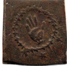
1/2 Pound - (1545 - 1550) - goud - 6,22 g – Engeland