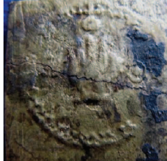
1 Vlies / Gouden vlies - (1496 - 1499) - goud - 4,49 g – Nederlanden